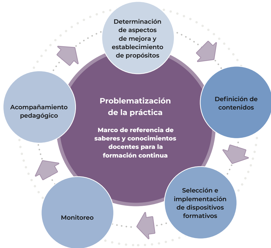
Figura 2. Componentes y proceso de diseño de las intervenciones formativas